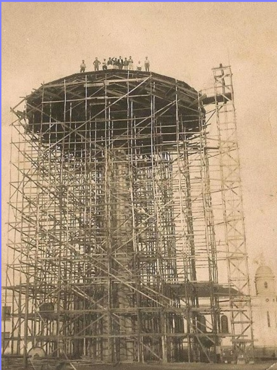
Construção Reservatório de Água – 19-- (?)

Tempos bons vieram. O asfalto chegou! E com ele a Praça dos Três Poderes, imponente! A prainha artificial, sucesso para os jovens! A praça da fonte, alegria da piazada! O cinema e praça da igreja, onde os namoros aconteciam às escondidas.