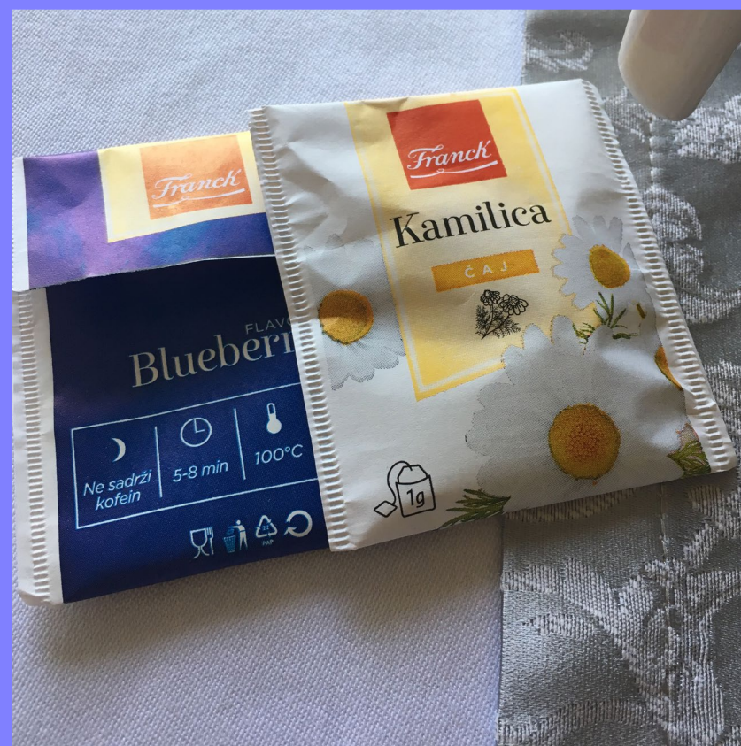
O chá de camomila

Odonda, svaki put kad pijem čaj od kamilice, sjećanja na djedove šale izmame osmijeh na moje lice – govorio bi kako moje ime podsjeća na ime čaja – u želji da ga ne razočaram, uvijek bih se složila da je sličan, premda sam tek nakon upoznavanja riječi i izgovora „kamilice“ na hrvatskom, napokon mogla, uistinu složiti se s njime.