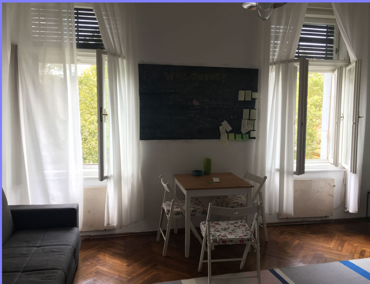
As janelas para o Parque Zrinjevac

Mješavina straha i očekivanja postupno je otopljena osmijehom policajca, koji mi je poželio ugodan boravak na hrvatskom teritoriju, i brazilskom glazbom koja je svirala u parku Zrinjevac u trenutku otvaranja prozora sobe u koju sam bila smještena.