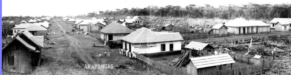
Povoado em 1937

A família, caminhando a pé no chão batido de cor vermelha, sob olhares atentos. Mineiros? Polacos? Estrangeiros? A curiosidade, quase que vigiando os novos habitantes de olhos claros e cabelos cor de palha.