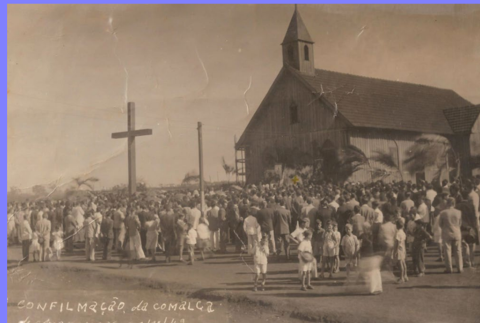
Missa campal de posse do 1º prefeito