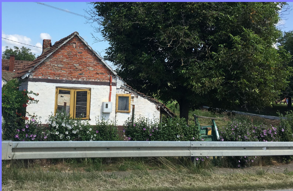
As casas antigas e as flores