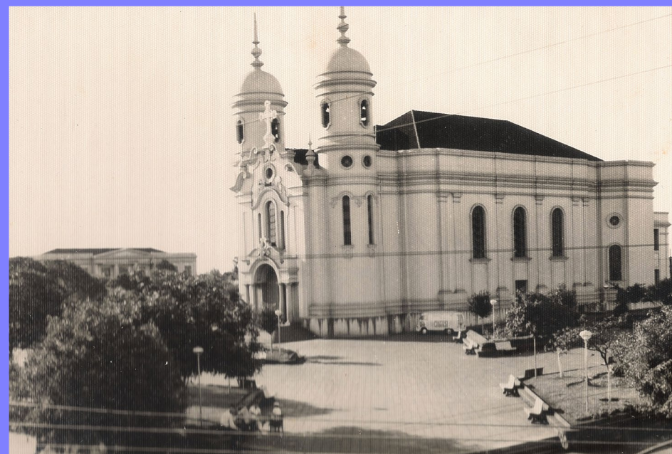
Igreja Matriz com duas torres - 1951

Chegada a hora de dividir as famílias! Vinte e uma pessoas numa mesma casa! Cada irmão para um lado. Mas as casas eram vizinhas. Conversavam pelo muro dos fundos.