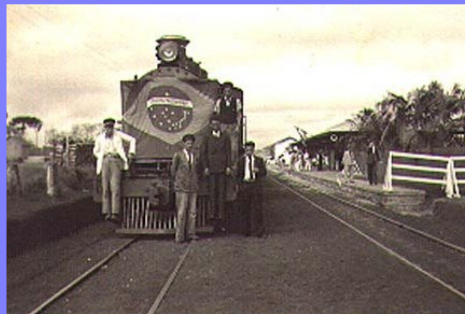
Povoado em 1937

Resumo de um povoado recém colonizado. Resumo de um recomeço de vida.